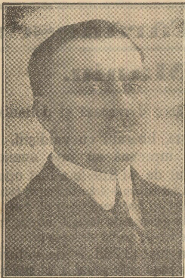
Dr. Iuliu Maniu.

Astfel liberalii au luat 140 de mandate, iar opoziția 223 de mandate.