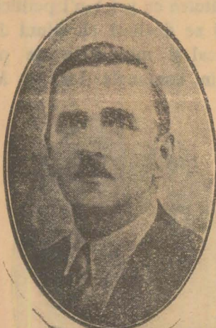
Di. Colonel Vasile Bancescu,

DI COL. VASILE BANCESCU, spune și Domnia Sa că partidul național-tărănesc este un partid democratic, cu rădăcini adânci în masa țărănească. — În fața dușmanilor cari pândesc țara, trebuie se fim uniți.