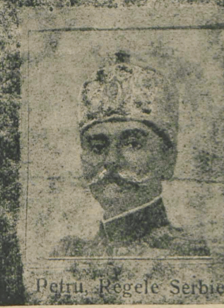
Petru, Regele Serbiei

alte mărfuri de aluat, cu începere dela 1 Martie n. au să folosească 50 de procente (adecă pe jumătate), făină de cucuruz. De pildă morile să nu macine decât o astfel de amestecătură, iar în orașe să nu se primească la cuptoarele de copt pâne, decât astfel de aluat amestecat. Dar fiindcă de prezent nu se află peste tot locul la îndemână destulă făină de cucuruz, guvernul a ridicat această ordinațiune. Totodată se vestește, că ea va fi pusă în aplicare îndată ce se va afla în vânzare destulă făină de cucuruz. Asupra împrejurării, că ordinațiunea aceasta se va întinde peste toată țara, sau numai în unele părți, — asta o va hotărî guvernul la timpul său.