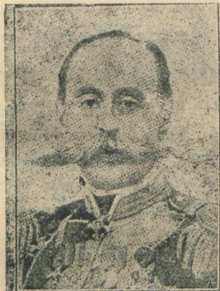
Generalul rus Kamenkamp