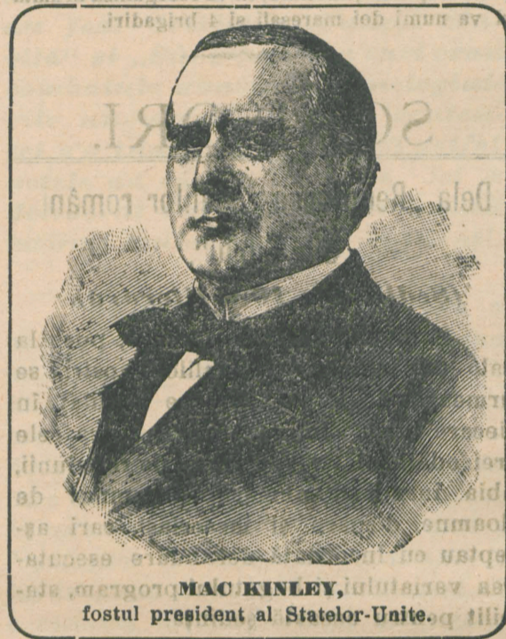
MAC KINLEY, fostul president al Statelor-Unite.

Din frumoasele ilustrații, ce împodobesc „Călimdarul Poporului“ pe anul 1902, dăm azi portretul lui Mac Kinley.