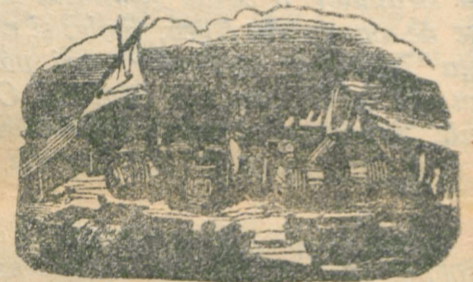
Târgurile din săptămâna aceasta (după calendarul nou):

8 Iulie: Zam. 9. Câmpeni, Covasna. 10. Oherla. 11. Dicio-Sânmartin, Gilău, Hodod, Peicaronă (jud. Arad). 12. Armeni, Cohalm, Oravița. 13. Alba-Inlia, Cehul-Silvaniei, Huedin, Praid.