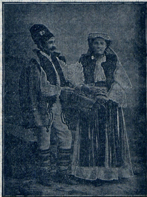
Români din Bănat.