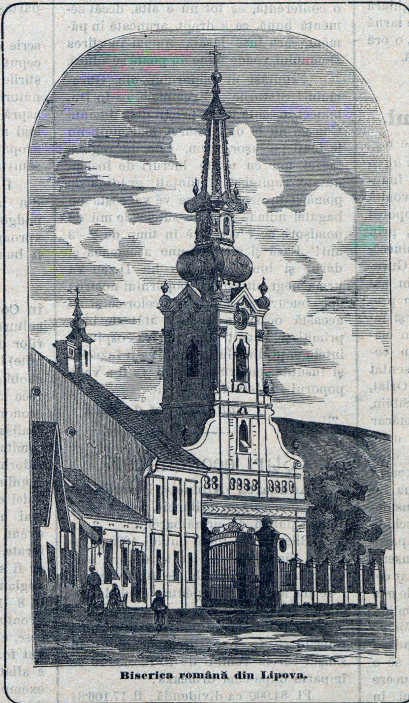
Biserica română din Lipova.

Fetelor din anul I.: Grădina de legume. Lucrarea pământului din grădină. Părțile lui constitutive. Cultivarea în special a tuturor legumelor.