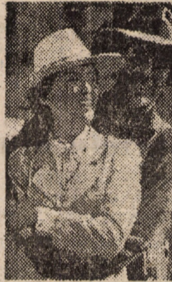
Titlul original: "Lost world", SUA '92. Regizor: Timothy Bond. Distribuție: John Rhys-Davies; David Warner; Eric McCormack.

Au murit saurienii de acum 60 milioane de ani? Excentricul cercetător Challenger afirmă că dinozaurii au supraviețuit pe un platou înalt din Africa. O expediție urmează să dovedească acest lucru.