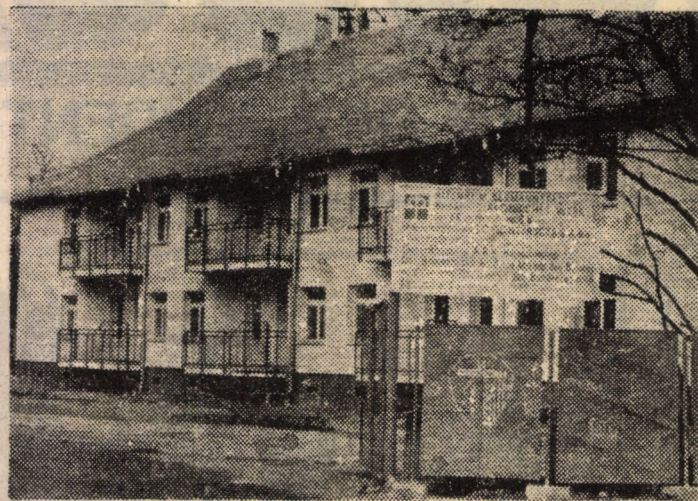
In curând va fi dat în folosință noul Cămin de bătrâni făcut de Ministerul de Interne German în colaborare cu SC Construcții SA.

telegazeta care și-au cerut scuze pentru că au promovat și propagat minciuna, nu de a fi trăit de pe urma ei, încercând să ne convingă de fapt că importante sunt numai convingerile intime. Au fost unii care au teoretizat îndelung chestiunea minciunii, ajungând să concluzioneze că de-a lungul timpului aceasta a fost forma de apărare obișnuită pentru noi, care nu i-am contrazis pe cei mai puternici pentru a supraviețui. Poate că din când în când această acceptare a minciunii oficializată prin negocieri de pagube politice și sociale este o soluție de moment, dar sunt convins că, ridicată la rang de principiu de cel de la Cotroceni, nu este decât o dovadă a lipsei de caracter.