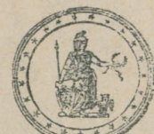
Medalie de bronz