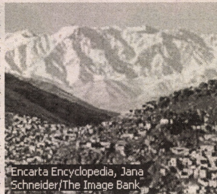
Encarta Encyclopedia, Jana Schneider/The Image Bank

nu au luat în seamă faptul că președintele Amin se va apăra cu arma în mână, nu a vrut să se predea viu, iar unul dintre parașutiști, surprins de reacția președintelui, l-a împușcat. Evenimentele au luat, astfel, o turnură nedorită. În avionul de întoarcere spre Moscova Vitea Paputin, conștient de implicațiile istorice și personale ale asasinării președintelui Amin, s-a sinucis prin împușcare. Greu de înțeles este faptul că președintele Amin avea în Kabul între 30.000 și 40.000 de militari, care nu au acționat pentru apărarea palatului prezidențial, ci au rămas tînuiți în unitățile lor.