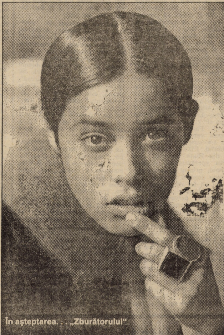
In așteptarea... „Zburătorului”