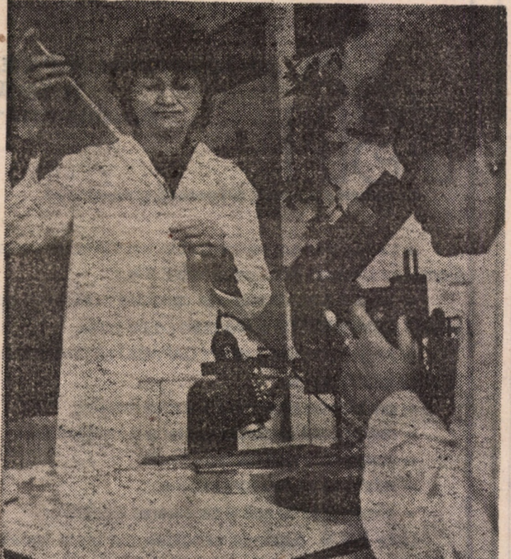
Asupra apei pe care o folosim în fiecare zi veghează cei de la Stația de tratare a apei Sibiu. În laboratorul de bacteriologie și chimie al instituției se efectuează din 4 în 4 ore analizele apei, de unde vă prezentăm imaginea de mai sus.

numai 10 zile de îngrijiri speciale și extrem de dificile. E plăcut să constăți că într-o lume tot mai dură și neomenoasă mai sînt, încă, și OAMENI DE MARE SUFLET! , ca acești medici, asistente, surori, laboranți și farmaciști de la Spitalul de Pediatrie din Sibiu; colectivele de la secțiile de reanimare, ANI neuroinfantilă și neurochirurgie. S-a evitat, astfel, drama unei familii cu 4 copii, după zile și nopți încordate, de neliniște și căutări, familie care astăzi este din nou reunită. Consemnare de Ioan VULCAN