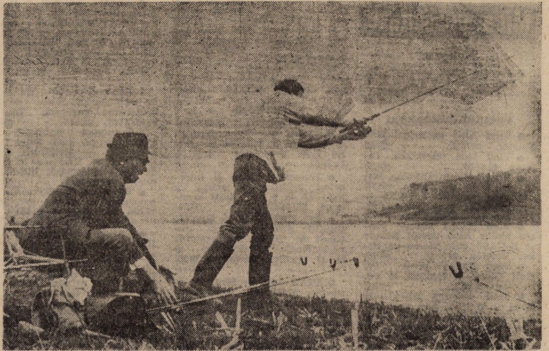
Mai deunăzi, un pasionat pescar ne-a semnalat existența unui mare număr de pești morți pe luciul lacului de la Săcel. Am aflat cauza morții peștilor. Mai în urmă vreme, gheața lacului s-a muiat și s-a lăsat sub apă, cițiva zeci de centimetri. Unele specii de pești, dar de dimensiuni mai mici, au ieșit din mil, strecurându-se în apa de suprafață... Dar, peste noapte, a venit un nou îngheț, formându-se un nou strat de gheață, peștii fiind „prinși” între cele două „planșee” de gheață... Vremea s-a încălzit din nou, gheața de suprafață s-a topit și, firesc, peștii morți au apărut pe luciul apei...

Ne-am convins că nu este ușor, în actualele condiții, să fi primarul unui municipiu. Oamenii așteaptă de la cei aleși multe. Dar singuri, primarii și consilierii nu vor putea face prea multe. Este nevoie să punem cu toții mâna la treabă. Cu cât o vom face mai repede, cu atât mai bine.