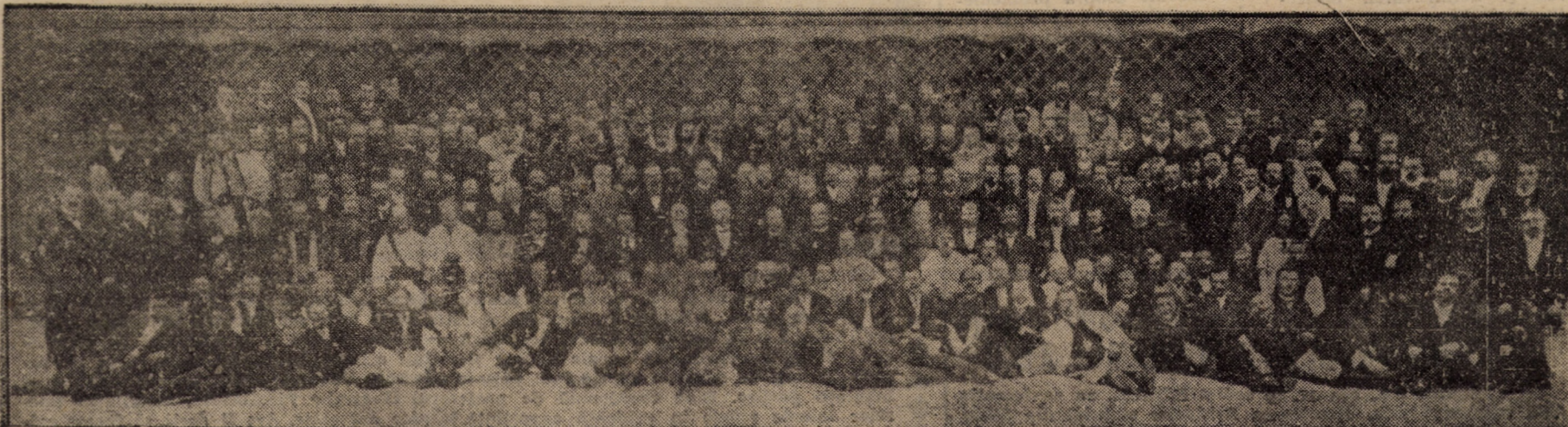
Deputațiunea română la Viena, în 27-29 Maiu 1892, care a dus Memorandul pentru a-l prezenta Monarhului Francisc Iosif; acesta însă nu a primit-o.