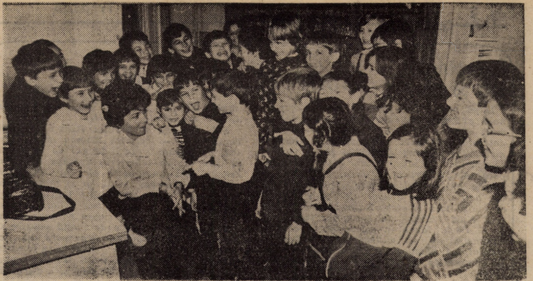
Și să vedeți așa a fost în vacanță!