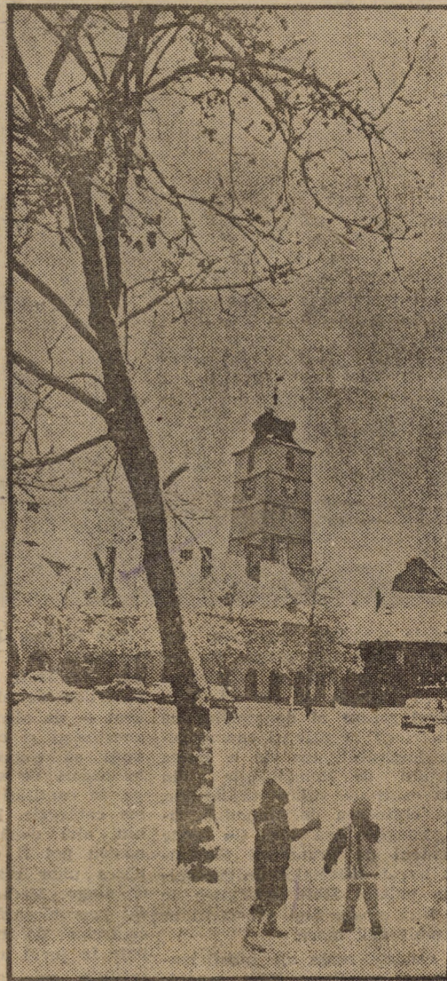
Rapsodie în alb cu copii și...turn. Sibiuul nostru este — orice s-ar zice — inegalabil diferent de anotimp.

(Consultant: media promotion ROSIBCLUB).