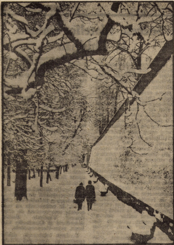
Feerie în alb și negru