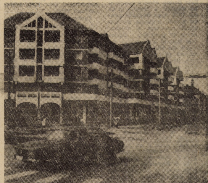
În zonele sistematizate ale municipiului Sibiu, noile construcții de locuințe, în bună parte cu parter comerciale, se încadrează armonios în arhitectura urbei noastre