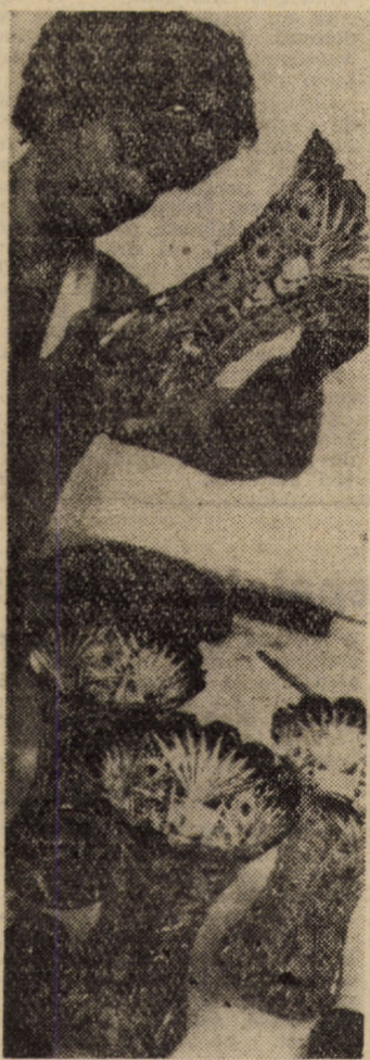
Produsele din cristal albastru, adevărate opere de artă ale sticlariilor de la „Vitrometan” Mediaș sînt apreciate unanim în rîndul beneficiarilor externi. În fotografie: înainte de expediere se efectuează un riguros control final al calității