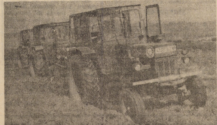
Folosirea, la executarea arăturilor, a unui număr cît mai mare de tractoare reprezintă o modalitate de creștere a vitezei zilnice de lucru.

lungă. Iată cîteva exemple selective, alese în funcție de mărimea suprafețelor care urmează să fie însămînțate: Blăjel (355 ha), Moșna (337 ha), Agnita (307 ha), Birghiș (330 ha), Chirpăr (446 ha), Ighiu Vechi (330 ha), Pelîșor (335 ha), Alma (445 ha), Loamneș (362 ha), Ocna Sibiului (340 ha), Cornătel (370 ha), Vurpăr (370 ha), Retiș (505 ha), Apoldu de Jos (459 ha), Ludoș (458 ha), Păuca (537 ha), Șelimbăr (410 ha), Ruși (479 ha) ș.a.