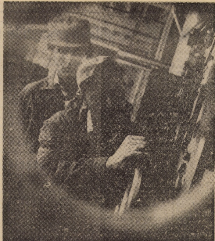
În cadrul atelierului de autoutilare al întreprinderii „Flamura Roșie” Sibiu, colectivul constructorilor de mașini se preocupă constant de realizarea unor utilaje cu caracteristici îmbunătățite, necesare procesului de producție

Din acest punct de vedere se pot aprecia eforturile și unele rezultate înregistrate la Cooperativa „Îmbrăcămintea” Sibiu. Aici, analiza efectuată de adunarea cooperativilor asupra realizărilor pe semestrul I, la indicatorul producție-marfă, a pus în evidență existența unei restanțe; urmare a măsurilor luate, aceasta a fost însă recuperată în luna iulie a.c., iar în luna august s-a acționat cu răspundere pentru menținerea unui ritm superior în activitatea de producție. Acum, la încheierea celor 8 luni ale anului, se poate spune că realizările la acest indicator sînt superioare cu 5,8 milioane lei față de cele din aceeași perioadă a anului trecut. Se cuvine să mai notăm și faptul că, în acest an, cooperativa se situează în rîndul unităților cu planul îndeplinit la export, domeniu în care se acționează cu toată răspunderea. De fapt, realizările sînt superioare cu 64 la sută față de cele din 1985, fapt ce demonstrează o pronunțată evoluție ascendentă în anii actualului cincinal. (C.B.)