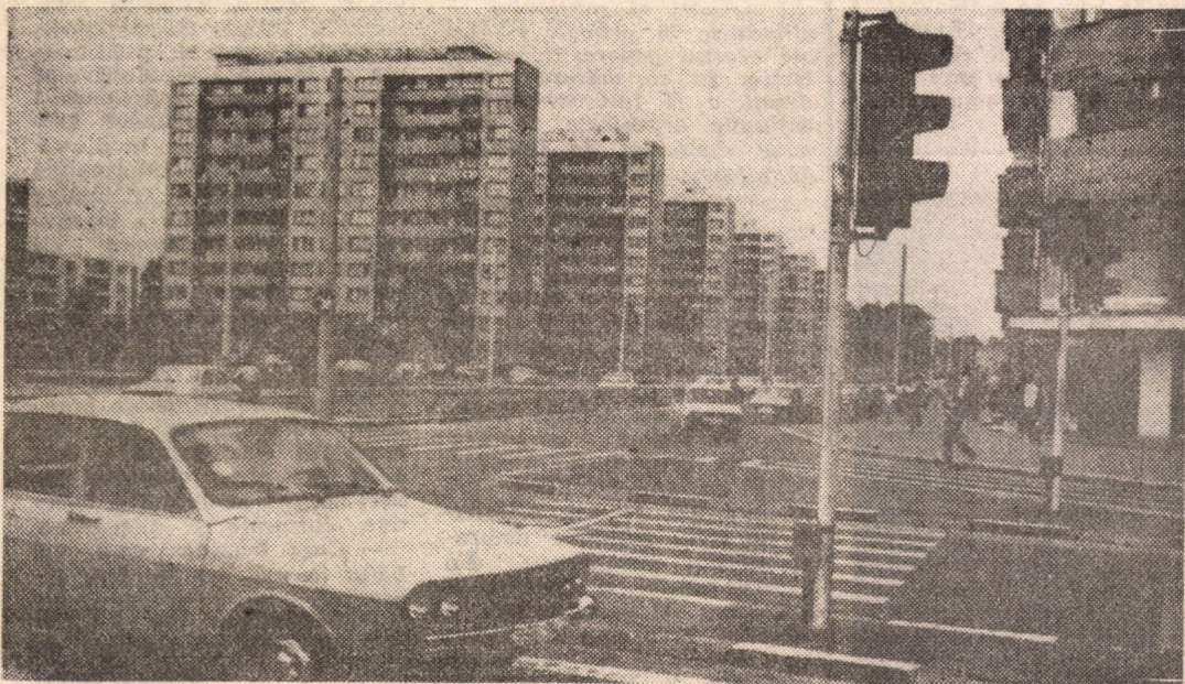
Intersecția B-dului Mihai Viteazul cu strada Kolarov, recent modernizată