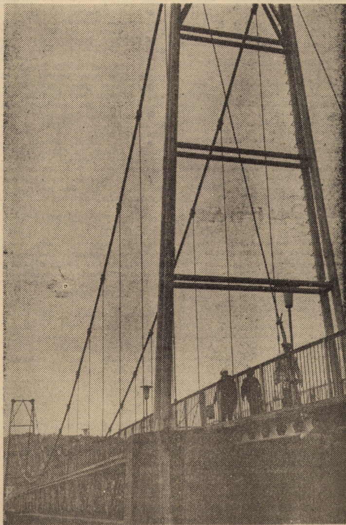
Medias. Pasarelă peste riul Tirnava. Una din realizările anilor „Epocii Nicolae Ceaușescu”