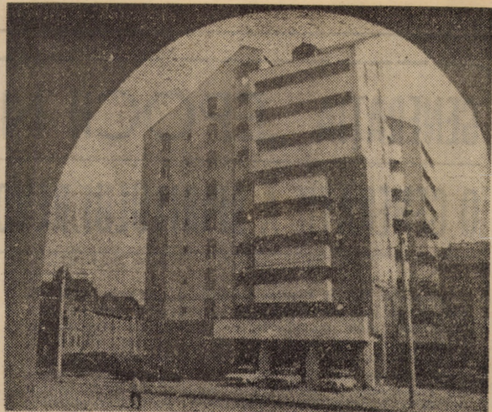
Sibiu — un oraș ce crește frumos și viguros ca toate orașele țării în „Epoca Nicolae Ceaușescu”. În fotografie: unul din noile blocuri, de curînd predate locatarilor, din str. N. Teclu

(Continuare în pag. a III-a) Ion SORESCU