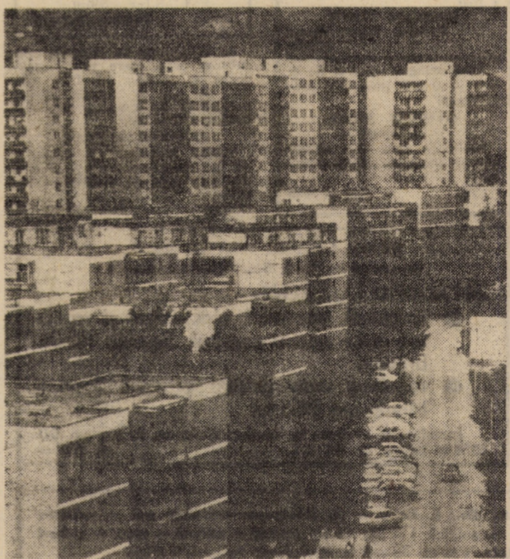
Mediasul contemporan. Construcții de locuințe ridicate în ultimele două decenii în cartierul „Gura Cimpului”

Toate acestea în interdependență lor globală, determină acumulări cantitative și salturi calitative înaintarea procesului de omogenizare, conturează modalități noi de întărire a unității socialiste a poporului, de prefigurare a poporului unei muncitor — tip istoric previzibil de constituire calitativ superioară a comunității umane în societatea noastră.