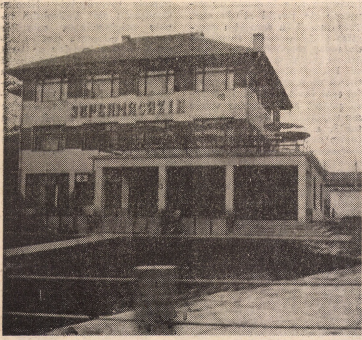
Frumosul Supermagazin din comuna Slimnic, unitate a coo-perației ridicată nu demult în această localitate

Biletele s-au pus în vin-zare la Agenția teatrală din Sibiu și la difuzorii volun-tari din întreprinderi și in-stituții.