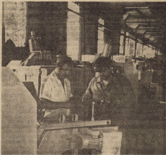
Control intermediar al pieselor la linia de strunguri revolve cu turelă verticală în secția unelte pneumatice a întreprinderii „Independența” Sibiu.

Cu acest prilej, tovarășul Nicolae Ceaușescu a acordat un interviu pentru ziarul spaniol „ABC”.