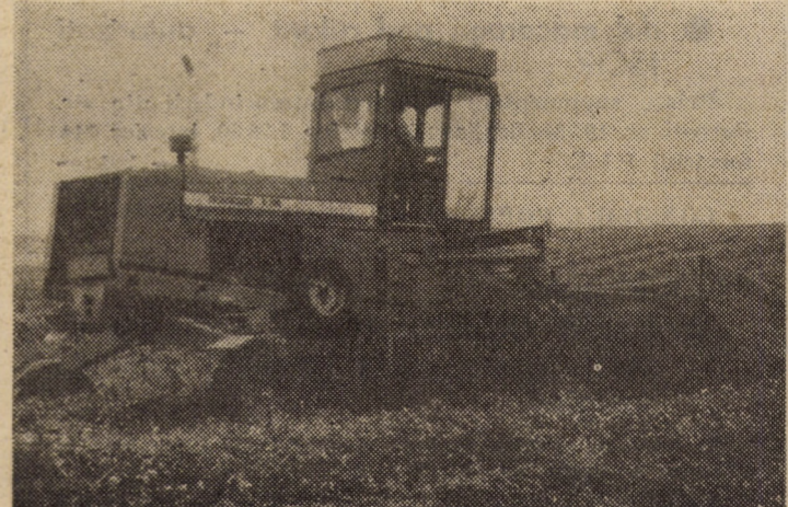
O acțiune în plină desfășurare: coasa a II-a la trifoliene pe terenurile aparținînd întreprinderii Agricole de Stat Șura Mică

Notăm, în încheiere, și obligația unităților de a acționa cu mai mare răspundere pentru realizarea planului la succulente (în prezent 45 000 t depozitate dintr-un plan de 93 000 tone) și la grosiere (6 000 t din 40 000 t), la ultima categorie de furaje mai ales prin intensificarea ritmului la eliberatul terenurilor de paie.