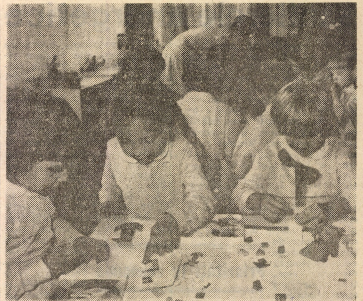
Momente de plină satisfacție in orele de aplicare a jocurilor logice la Grădinița nr. 7 din orașul Cisnădie

lecular. Aceasta pentru a putea accepta sau infirma eficacitatea tratamentelor pe o asemenea bază. Dezideratul O.M.S. — „Sănătate pentru toți în anul 2000” poate fi atins numai prin aplicarea acestei metodologii — a fitoterapiei — deoarece s-a calculat că cca. 90 la sută din populația lumii nu are acces la medicamentele produse pe calea sintezei minerale, dar și datorită efectelor secundare ale acestora care încă nu au fost determinate în timp. Or noi avem plante verificate de practica umană de mii de ani”. Cum îi apreciați pe cei care practică a-