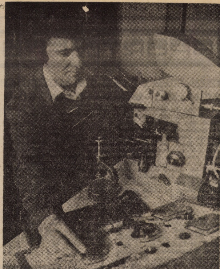
Examinări ale structurii pieselor tratate termic în laboratorul metrologic al I.M.A. Sibiu

Astăzi, 20 VI, ora 19, Filarmonica de Stat din Sibiu susține obișnuitul concert săptămânal.