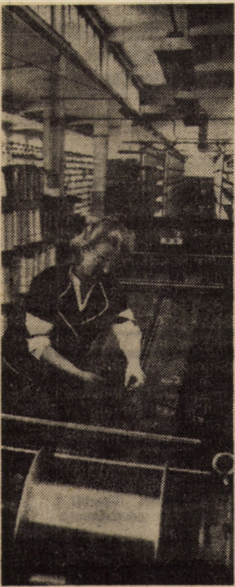
Calitatea țesăturilor — un deziderat și al colectivului de muncitori din secția urzită a Intreprinderii „Drapelul Roșu” Sibiu.

Cu siguranță, acest decalog, chiar integral rezolvat în cele mai mici amănunte nu „rezolvă problema”. Este nevoie de: educație educație, educație, fermitate, fermitate și, mai ales de autentică implicare în toate a opiniei publice, a spiritului civic cu valențe recuperatoare și mobilizatoare. Cu siguranță un cuvînt hotărîtor îl vor avea cei ce reprezintă municipalitatea, școala, familia, instituția, organele în drept, căci în asemenea probleme, e bine să nu uităm nici o clipă, mai ales cînd „ne plîngem” de cutare sau cutare, că face altfel decît ar trebui să facă. Valabil și pentru municipalitate, și pentru școală, și pentru familie, și pentru instituție!