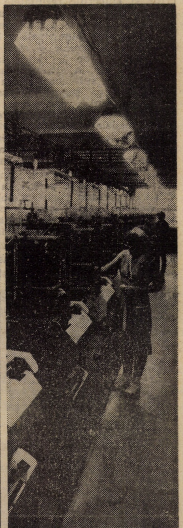
Secvență de muncă într-unul din atelierele de tricotate la întreprinderea „7 Noiembrie” Sibiu

La Mediaș, activitatea de creație tehnico-științifică — pe agenda priorităților absolute (în pag. a II-a)