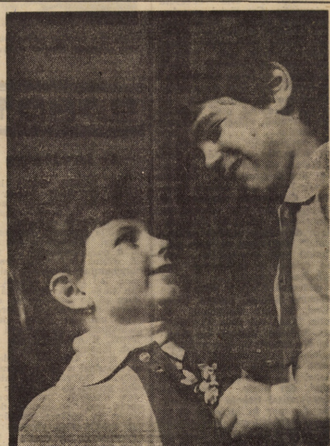
În viața lor, plină de soare, De MARTIȘOR, în dar... o floare!