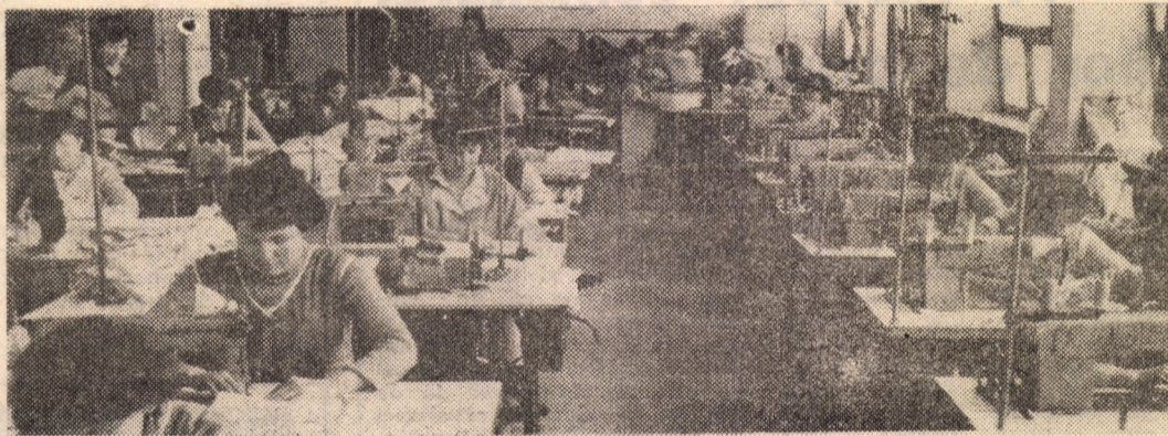
Una din liniile tehnologice pentru confecționat produse destinate exportului la Întreprinderea „Steaua Roșie” Sibiu