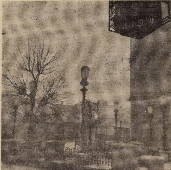
Detaliu dintr-un străvechi peisaj sibian