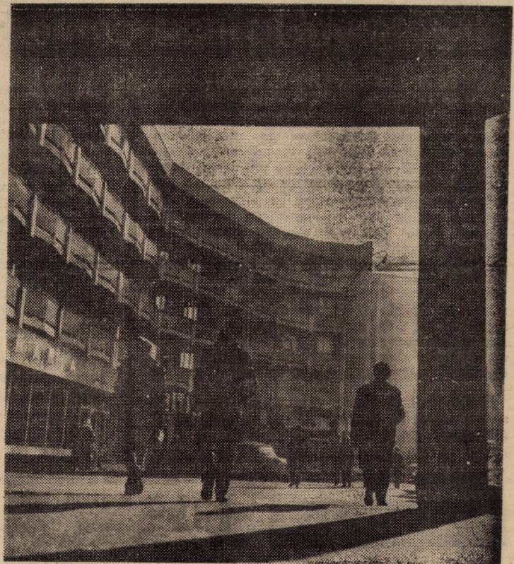
Peisaj urbanistic sibian într-o dimineață de februarie