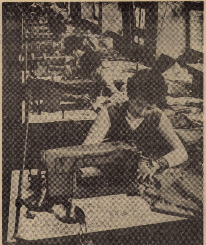
Linie tehnologică de la „Steaua Roșie” Sibiu, o întreprindere la care îmbunătățirea permanentă a calității produselor este un obiectiv esențial, urmărit în permanență de membrii formațiilor de lucru din toate secțiile de producție