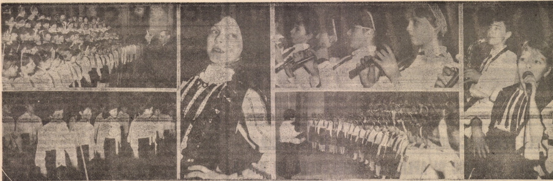
Joi, 9 februarie a.c., pe scena Centrului de Cultură și Creație „Cîntarea României” al municipiului Sibiu s-a desfășurat faza municipală a Festivalului Național „Cîntarea României” la care au luat parte sute de pionieri din cadrul C.M.O.P. Sibiu, membri ai formațiilor artistice și interpreți individuali. În fotomontajul de mai sus vă prezentăm instanțele înregistrate pe peliculă din prima zi a concursului, cu formațiile muzicale.