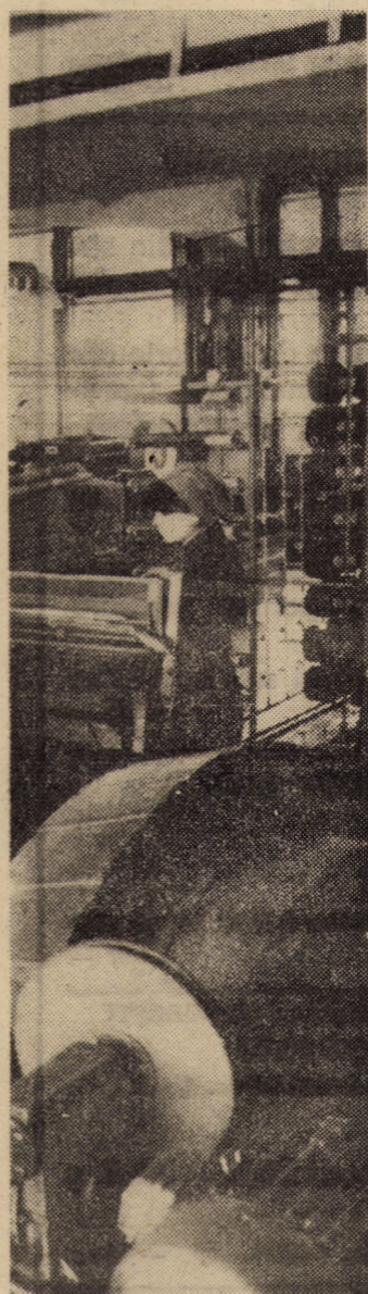
Întreprinderea „Libertatea” Sibiu. Încă din prima lună a noului an, harnicul colectiv de muncă al acestei unități s-a remarcat prin bune rezultate în producție

Cum este și firesc împlinirea unui an constituie baza temeinică de pornire în înfăptuirea obiectivelor viitorului. În anul 1989, în ceea ce privește activitatea edilitară gospodărească, la Șeica Mare cîteva din aceste obiective se