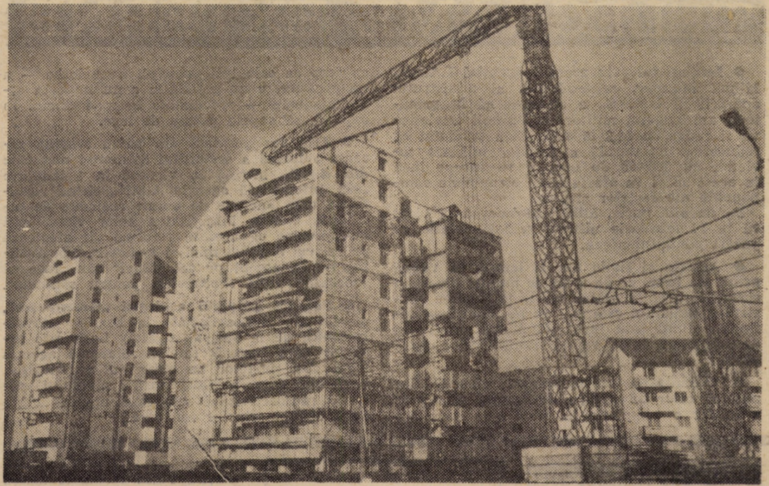
○ inscripție-document pe peliculă a noilor construcții ridicate în zona Pieții „1 Decembrie 1918” din localitate