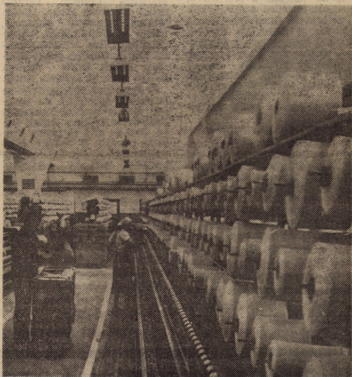
Secvență de muncă din filatura întreprinderii „Firul Roșu” Tâlmăciu