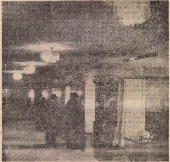
Din interioarele secției de istorie, deschisă recent în cadrul muzeului din municipiul Mediaș.

dezvoltarea democrației impune ca o necesitate obiectivă intensificarea activității partidului, cresterea răspunderii cadrelor de partid, a activului, a comunistilor, în toate domeniile, în vederea bunei funcționări a acestor organisme”. În aceeași ordine de idei, secretarul general al partidului a subliniat în repetate rînduri că asumarea de către partid a rolului său, de mare răspundere istorică, națională și internațională și modalitățile de exercitare a acestui rol nu sînt și nu pot fi cuprinse în tipare date o dată pentru totdeauna, ci evoluează permanent, corespunzător condițiilor și sarcinilor specifice fiecărei etape și trebuie permanent adaptate acestor condiții și cerințelor noi. Aceasta pretinde fiecărui comunist, fiecărei organizații de partid o înaltă răspundere în îndeplinirea tuturor sarcinilor economico-sociale și politico-ideologice, cere fiecăruia dintre noi muncă, energie, spirit revoluționar, combativitate, cercetare științifică și învățtură, asimilarea celor mai noi cuceriri ale cunoașterii umane, o înaltă înțelegere a imperativelor supreme ale acestei etape de mare semnificație în istoria patriei noastre socialiste.