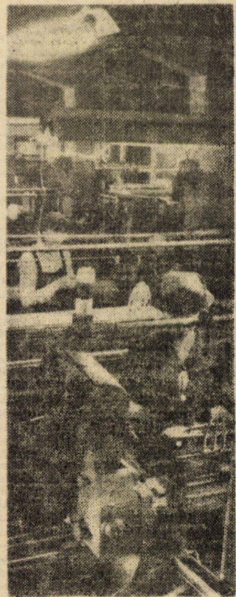
Intreprinderea „Libertatea” Sibiu. După ce firele au parcurs întregul itinerar al tehnologiei de prelucrare, în secția țesătorie „iau naștere” apreciatele țesături, produse mult solicitate pe piața internă și externă. În fotografie: aspect de muncă din hala războaielor de țesut.

Demersul teoretic și practic întreprins în mod sistematic de partidul și statul nostru pentru ridicarea nivelului profesional și cultural al clasei muncitoare, al tuturor oamenilor muncii se referă direct la viitorul patriei, al poporului nostru, concretizîndu-se în procesul revoluționar de omogenizare socială, de formare și educare a omului nou, profund devotat idealurilor socialismului și comunismului. „Trebuie să avem permanent în vedere — sublinia tovarășul NICOLAE CEAUȘESCU — că numai un popor cu un înalt nivel de pregătire în toate domeniile, cu o înaltă cultură științifică va putea participa activ la schimbul de valori materiale și spirituale și va putea fi cu adevărat liber și independent! Numai cu un asemenea popor, cu o asemenea înaltă pregătire vom asigura făurirea cu succes a comunismului în patria noastră, vom realiza visul de aur al omenirii — o lume fără exploatori, a colaborării egale între toți oamenii de pe planeta noastră!”