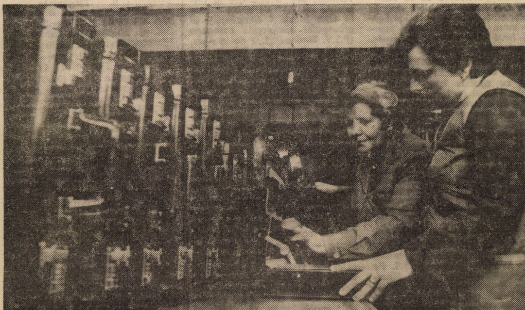
Întreprinderea „13 Decembrie” Sibiu. Punct de control final al produselor la capătul liniei de fabricație a truselor diplomat, destinate exportului

Valeriu OBOGEANU, secretar adjunct cu probleme de propagandă al Comitetului Orașenesc Cisnădie al P.C.R.