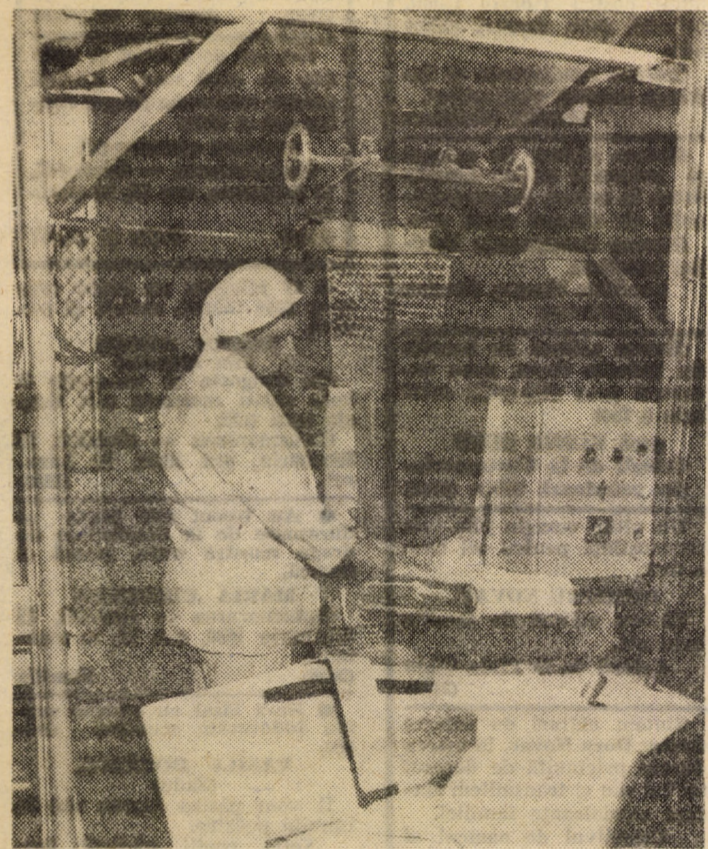
Întreprinderea de morărit, panificație și produse făinoase Sibiu. În imagine, una din instalațiile de dozare și formare a piinii la capătul unei linii de fabricație de la noua fabrică de piine din cartierul Hipodrom

Rezultatele superioare obținute anul trecut au la bază o mai riguroasă planificare a muncii și acțiunilor, mobilizarea mai susținută a mijloacelor materiale, financiare și umane, dinamizarea actului de organizare, coordonare și control în toate sectoarele de activitate. Relevant este că organul local al puterii și administrației de stat a elaborat și adoptat o serie de hotărâri și decizii care au statornicit o viziune de largă perspectivă și aplicabilitate dezvoltării intensive și calitative a fiecărui domeniu de activitate. Pozitiv este că în multe hotărâri și decizii s-au