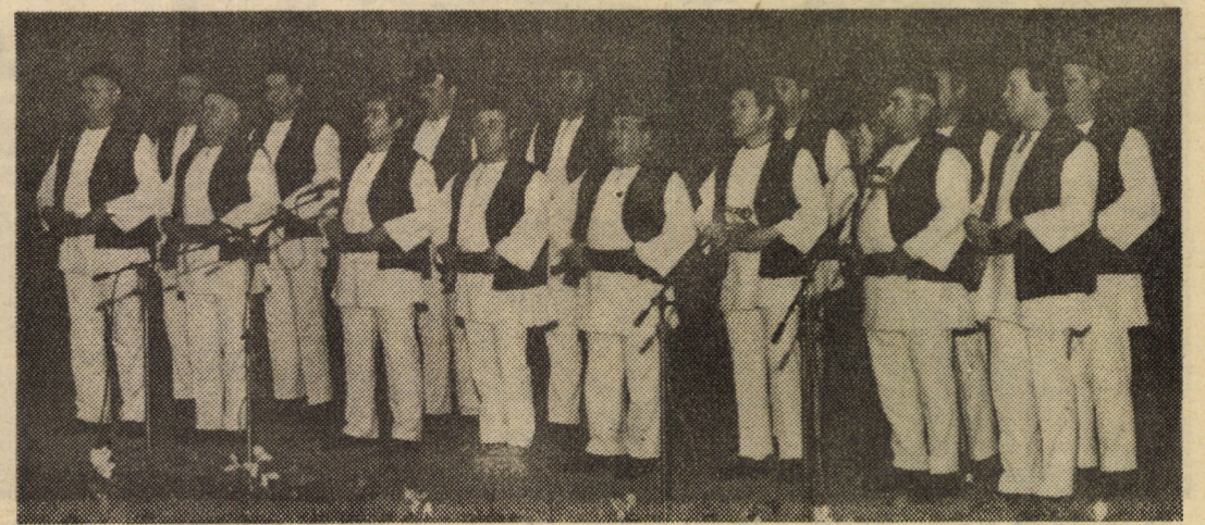
Renumitul grup vocal folcloric bărbătesc din comuna Orlat — laureat, în mai multe rînduri, la Festivalul național „Cîntarea României“ — evoluînd într-un recent spectacol pe scena Casei de cultură a sindicatelor din Sibiu