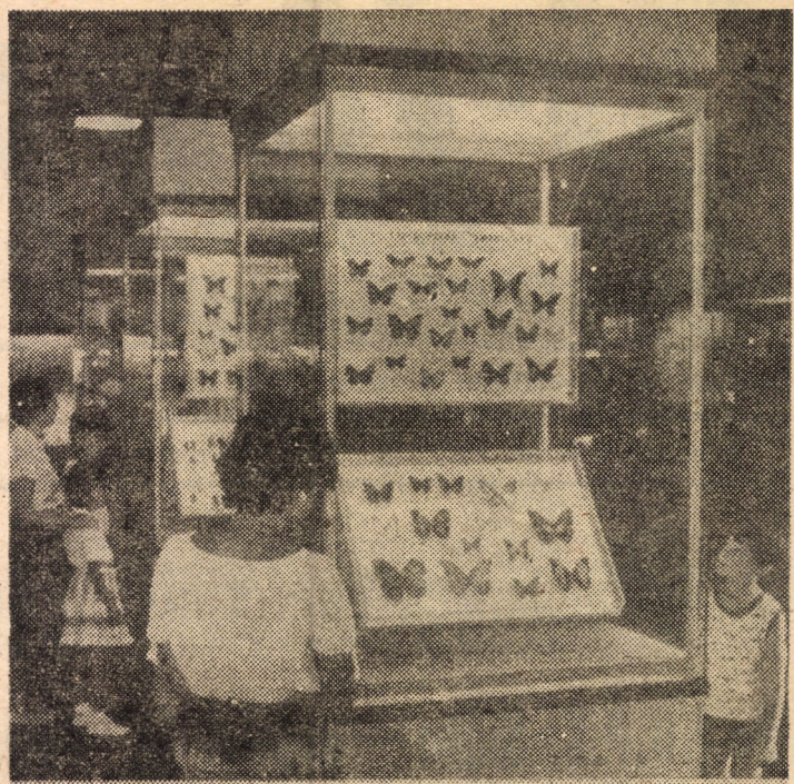
Prin exponatele sale de excepție, Muzeul de științe naturale al Complexului muzeal Sibiu reprezintă un punct de mare atracție, mai ales pentru vizitatorii din rîndul copiilor