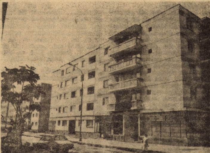
Cartierul de locuințe Ștrand din Sibiu dispune în prezent de tot mai multe blocuri cu parter comercial

Tovarășul Nicolae Ceaușescu și-a exprimat convingerea că toți oamenii muncii care își desfășoară activitatea în domeniul comerțului exterior vor acționa cu abnegație și spirit revoluționar pentru îndeplinirea sarcinilor ce le revin din planul pe acest an și pe întregul cincinal, din documentele Congresului al XIII-lea al Partidului Comunist Român.