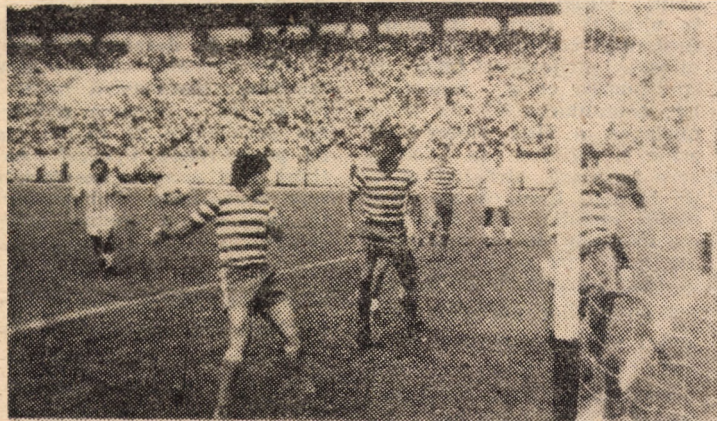
Cinci jucători craioveni, grupați în fața porții lui Boldici, se opun... golului (aspect din partida F.C. Inter — Electroputere)