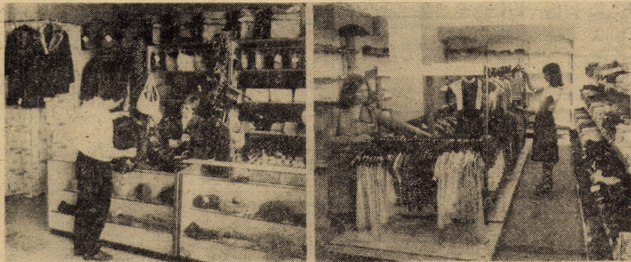
Doă dintre noile unități comerciale deschise în cartierul „Valea aurie” din Sibiu: În stînga: Unitatea nr. 51 aparținînd cooperativei „Gheata” cu articole de blănărie, marochinărie, încălțăminte, genți voiaj, ghiozdane, etc. în dreapta: Unitatea nr. 82 „lonu”, găzduită la parterul blocului nr. 51, specializată în articole pentru noi născuți și copii

Pagină realizată de Mircea BIȚU