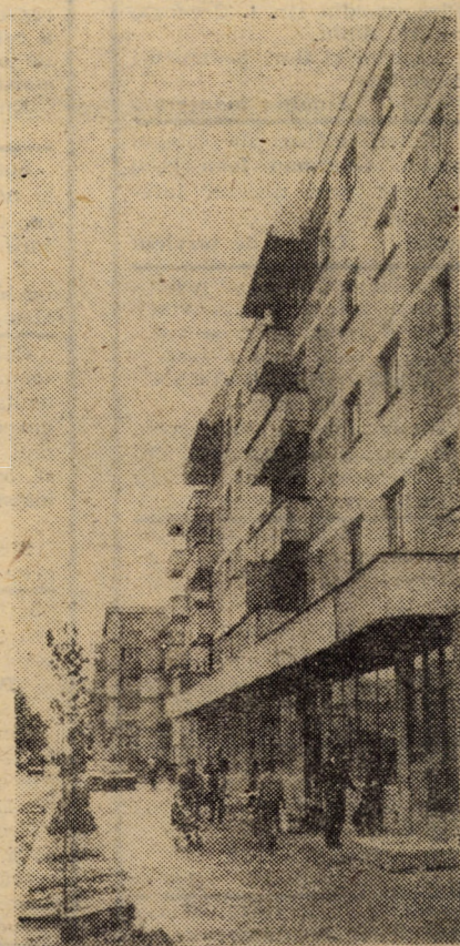
Imagine din cartierul „Valea aurie” Sibiu

În concepția secretarului general al partidului nostru, edificarea unei economii dinamice, de înaltă eficiență, înseamnă o economie pentru om, făurită conștient și destinată să-i creeze condiții de viață și de muncă mereu mai bune. Așa se explică preocuparea statornică, asiduă a președintelui României pentru dezvoltarea forțelor de producție, orientarea și subordonarea întregii economii naționale țelului suprem al orînduirii socialiste — creșterea permanentă a bunăstării materiale și spirituale a poporului.