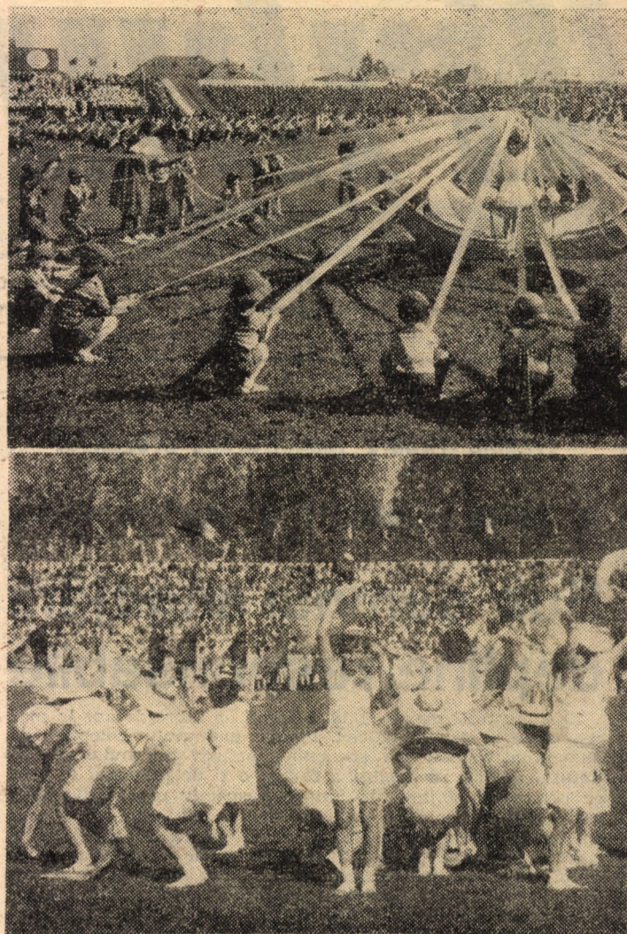
Aspecte de la spectacolul cultural-sportiv consacrat celei de-a 42-a aniversări a victoriei revoluției de eliberare socială și națională, antifascistă și antiimperialistă, desfășurat la Sibiu pe stadionul Municipal

În încheierea lucrărilor a luat cuvîntul tovarășa Elena Nae, prim-secretar al Comitetului județean de partid, care a analizat, în spiritul exigențelor formulate de tovarășul Nicolae Ceaușescu, rezultatele obținute în agricultura județului, măsurile ce se impun pentru aplicarea în viață a programelor adoptate. A cerut, totodată, organelor și organizațiilor de partid, consiliilor populare, conducătorilor colective ale unităților agricole, specialiștilor, tuturor locuitorilor satelor maximum de mobilizare, de ordine și disciplină pentru încheierea în timpul stabilit a tuturor lucrărilor de strîngere a recoltei și pregătirea producțiilor viitoare pentru a atinge nivelele prevăzute. Tovarășa prim-secretar a cerut, de asemenea, generalizarea grabnică a experienței dobîndite în unitățile frunțase, a tot ceea ce s-a văzut pe viu în județul Olț, pentru sporirea radicală a producțiilor în toate unitățile agricole, iar organele și organizațiile de partid din unitățile agricole, consiliile populare, organele agricole județene să asigure îndeplinirea în toamă a sarcinilor și orientărilor tovarășului Nicolae Ceaușescu, secretar general al partidului, expuse în cuvîntarea la recenta Consfătuire cu activul de partid și de stat din agricultură.