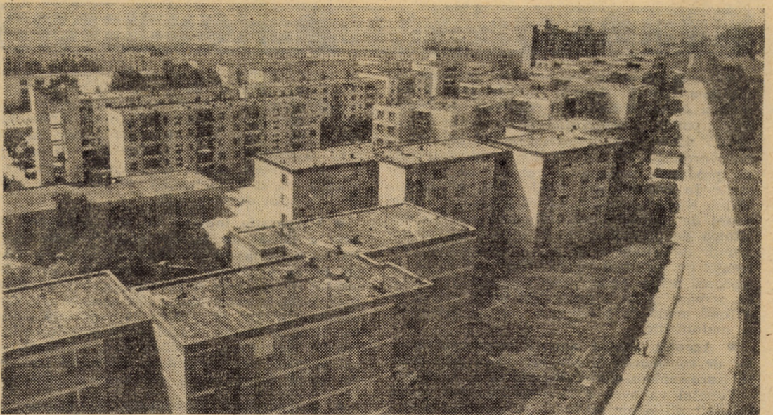
vedere panoramică a cartierului „Gura Cimpului” din municipiul Mediaș