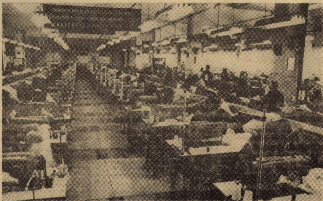
La „Drapelul roșu” Sibiu în această perioadă se organizează zile record în producție pentru devansarea realizărilor și livrărilor pentru export. În imagine: aspect al organizării execuției confecțiilor prin folosirea transportului mecanizat între faze

Localitățile noastre, mai frumoase, mai bine gospodărite