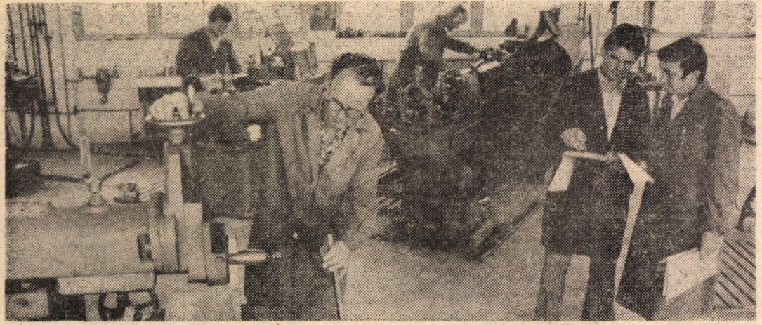
In imagine; noul atelier de sculărie al cooperativei „Tehnica nouă”.