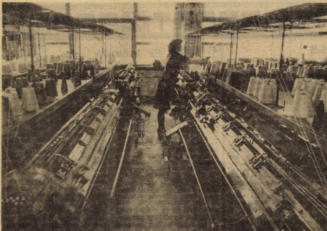
Cu ajutorul mașinilor automate rectilinii de tricotate de care dispune, Întreprinderea de mănuși și ciorapi Agnita realizează azi tricofuri într-o mare varietate de desene și culori.