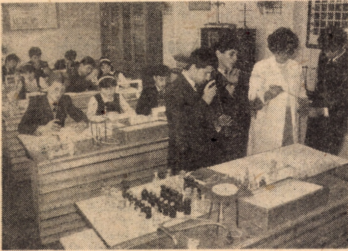
Prin recente modernizări și dotări cu aparatura necesară, laboratoarele de fizică și chimie ale Liceului industrial nr. 1 de petrol din Medias oferă condiții optime pentru efectuarea experiențelor specifice acestei unități de învățământ.

Montajul literar-muzical „Străbună vatră românească”, pe versuri de Al. Andrițoiu, a relăsat tradițiile de luptă ale poporului român pentru împlinirea idealurilor de dreptate, libertate națională și socială, marile izbâzi obținute în anii socialismului, mai ales în rodnicul arc de timp al „Epopiei Nicolae Ceaușescu”. Grupul vocal din Moșna și duetul Schrom Erica — H. Friedsam din Alma Vii, ca și formația de dansuri germane (Moșna) au îmbogățit și diversificat paleta acestei manifestări artistice de înaltă ținută. (Gh. Bușoi).