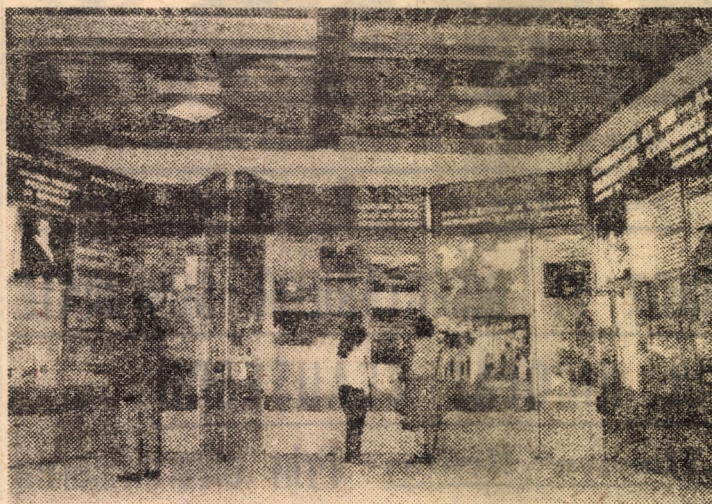
Aspecte din expoziția „Epoca Nicolae Ceaușescu — epoca celor mai rodnice împliniri din istoria poporului român”

Unitatea de monolit a poporului în jurul partidului, al secretarului său general, ceea ce a potențat marile energii constructive ale patriei pe calea progresului și