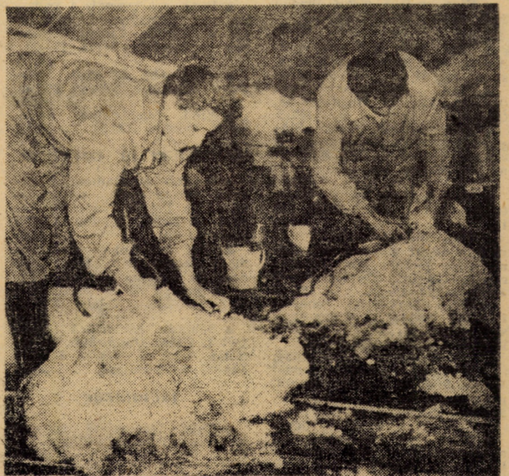
În această perioadă, în centrele special amenajate, în cadrul județului, se desfășoară tunsul oilor. La centrul din ferma III — Poplaca a S.C.P.C.O. Cristian utilajele mecanice din dotare funcționează ireprosabil, iar tunsul îl execută personalul specializat.