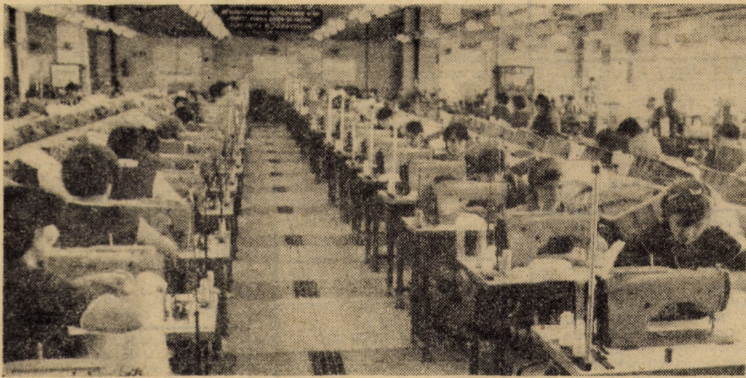
Vă prezentăm o vedere parțială din secția confecției mătase a întreprinderii „Drapelul roșu” din Sibiu, un exemplu edificator privind modernizarea atelierelor de producție, precum și buna organizare a fluxului tehnologic în cadrul acestei unități.

În ultima vreme Mediașul nu este doar un oraș frumos și puternic industrializat, ci și un oraș curat. Un oraș pe străzile cărui pășești cu grijă, atent să nu „atentezi” la curățenia urbei. Fără să-ți dai seama, poate, că edili municipiului de pe Tirnava Mare, laolaltă cu locuitorii urbei, au depus și depun strădanii demne de laudă pentru ca orașul să arate „ca scos din cutie”.