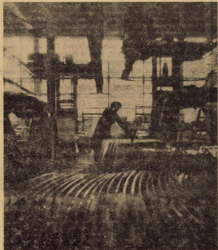
Vă prezentăm un aspect de muncă din secția securizat geomuri curbate — unul din compartimentele de bază ale întreprinderii de geomuri Mediaș