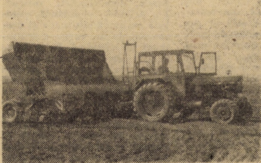
Plantatul cartofilor de toamnă — o lucrare urgentă pentru finalizarea căreia se impune o amplă mobilizare de forțe