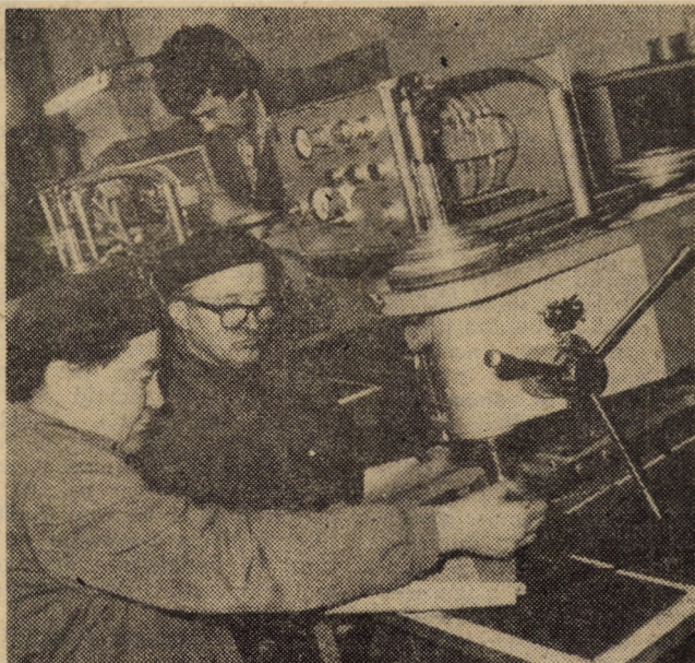
Ultimele verificări înaintea expedierii noilor mașini către beneficiarul extern