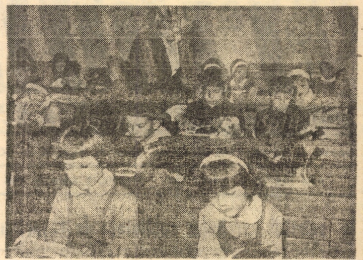
Bucurio de a învăța în condiții optime, încă încă una din marile realizări umaniste ale socializmului

● Alte două accidente au avut loc tot în 17.1. a.c. La ora 6,30, neconducînd preventiv în momentul depășirii unui autobuz din care coborau pasagerii (în zona Independența II din