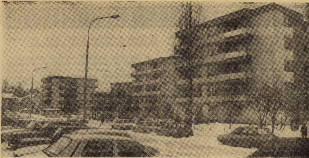
Din peisajul cartierului Ștrand din Sibiu