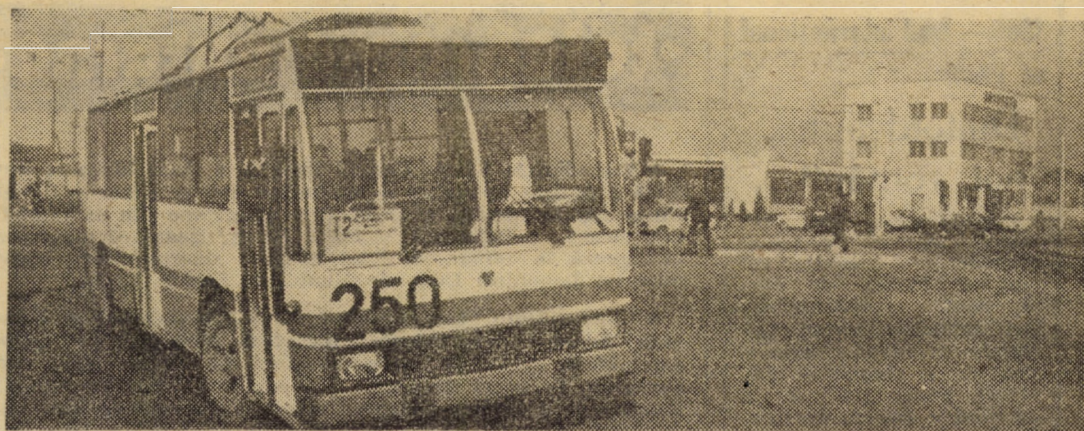
Troleibuzele sibiene parcurg în acest an și un nou traseu pînă la autogara nr. 2 de călători. În imagine zona de pe podul peste Cibin, la capăt de linie.

Eliminarea acestor neajunsuri presupune o mai atentă implicare a organelor și organizațiilor de partid în buna desfășurare a învățămîntului de partid, creșterea răspunderii birourilor și a întregului activ de partid. Se impune, totodată, efectuarea unor analize periodice asupra calității acestui important domeniu în adunările generale și ședințele sau plenarele comitetelor de partid. În acest sens, este necesară, ca o modalitate de lucru eficientă, prezentarea periodică de informări de către propagandiști asupra modului în care se achită de sarcinile primite, prezenta la învățămîntul de partid, participarea la dezbateri etc. Respectînd aceste cerințe, valențele formativ-educative ale învățămîntului politico-ideologic vor putea fi puse în valoare și vor deveni un sprijin eficient pentru organizațiile de partid în eforturile lor de realizare a sarcinilor sociale-economice.