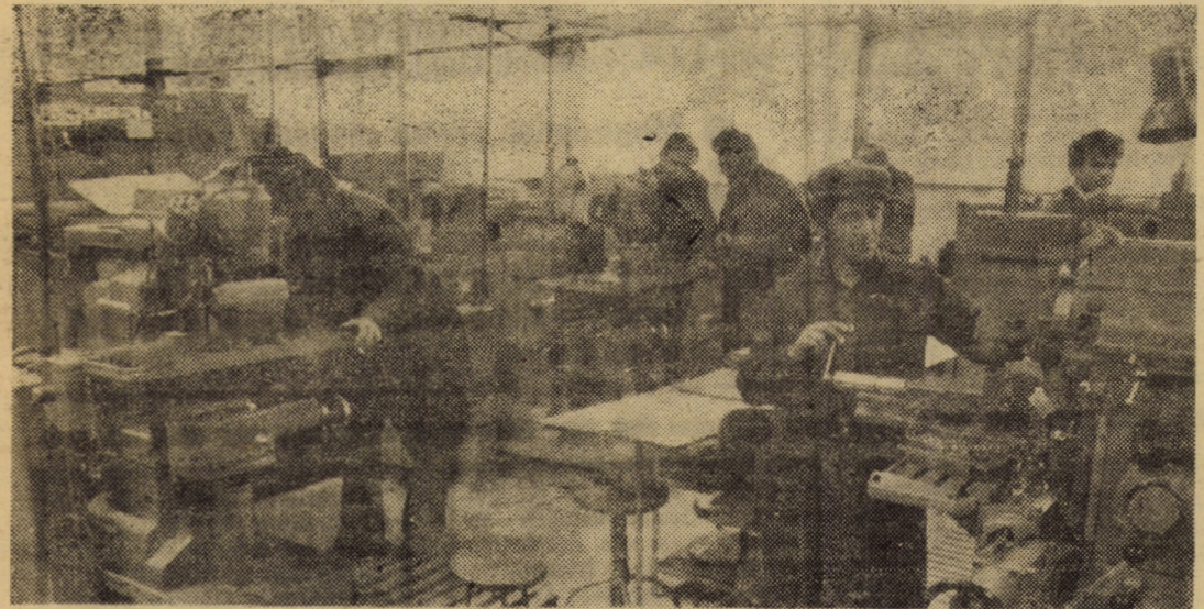
Prin cadre cu o bună pregătire profesională, noua școală de întreprinderii „Balanța” din Sibiu asigură întreaga gamă de S.D.V.-uri de înaltă complexitate, necesară secțiilor de producție

Vă mulțumim și vă dorim succes în noul an!